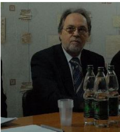
со встречи в Назрани см. ниже

ПРАВозащитный центр "Мемориал" 29 марта 2010 года Web-site: http://www.memo.ru